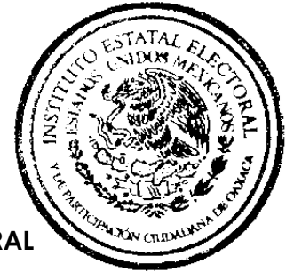
03 CONSEJO DISTRITAL ELECTORAL LOMA BONITA